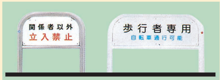
41-5 ●W700×H900mm 41-6 ●W1000×H900mm