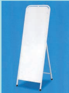
●板面：アルミ複合板 3t