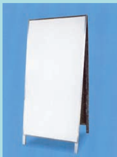
●板面：アルミ複合板 3t