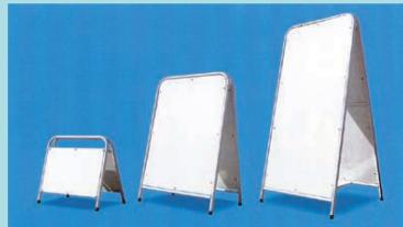
●板面：アルミ複合板 3t