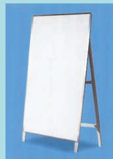
●板面：アルミ複合板 3t